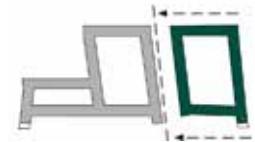
Modul C - Modulaufbau B+C