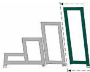
Modul E - Modulaufbau B+D+E