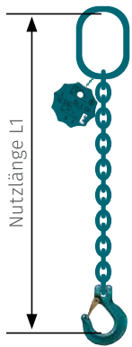
Gabelkopfhaken 01 - GH

mit Standardaufhängekopf, ohne Verkürzungsklaue