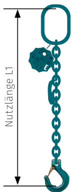
Gabelkopfhaken 01 - GH

mit Standardaufhängekopf, mit Verkürzungsklaue